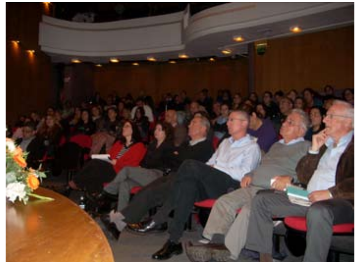
לתמונות נוספות מיום העיון לחץ

בראשית חודש ינואר ערכה המגמה לקרימינולוגיה יום עיון שכותרתו "חומרים פסיכואקטיביים, אלימות מינית ומה שביניהם", בשיתוף עם הרשות הלאומית למלחמה בסמים ואלכוהול ועם מרכז הסיוע לנפגעות ונפגעי תקיפה מינית - השרון. יום העיון עסק בתופעה הרחבה