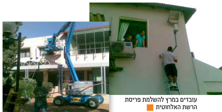
עובדים במרץ להשלמת פריסת הרשת האלחוטית ■

את הפרויקט הקימה חברת "בינת תקשורת" המתמחה בתחום זה ובהקמת רשתות דומות באוניברסיטאות ובמתחמים ציבוריים. מטעם המכללה ליוו את הפרויקט יובל אלדד - ראש היחידה למשאבי מחשוב, מוהנד עיראקי - האחראי על תחום תקשורת הנתונים ביחידה למשאבי מחשוב ואלון פינטו - האחראי על רשת המחשבים בחודשים האחרונים. היקף ההשקעה בפרויקט עמד על כ-1.5 מליון ש"ח.