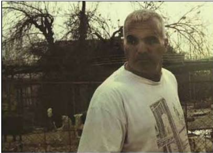
מתוך: האני. בימוי וצילום: עדי הראל; עריכה: ג'ון אבישי (40 דק', ישראל, 2011).

הסרט "האני", זוכה פסטיבל דוקאביב 2011 לסרט הסטודנטים הטוב ביותר, הוקרן ביום שני 9.12.11, בערוץ yes דוקו. הסרט עוסק בהאני, פלסטינאי בן 48, שעובד וחי במשך השבוע במתחם צער בעלי חיים בירושלים הניצב בסמוך לגדר ההפרדה. הסרט עוקב אחר שגרת יומו של האני והתדרדרות מערכת היחסים שלו עם הישראלים, בעקבות אירוע בו נפצעות שתי כלבות בעת משמרת הלילה.