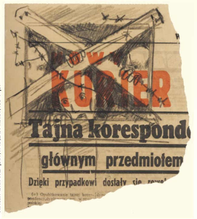
יוסף ריכטר, תחיה למוס, 1943, אוסף בית לוחמי הגטאות