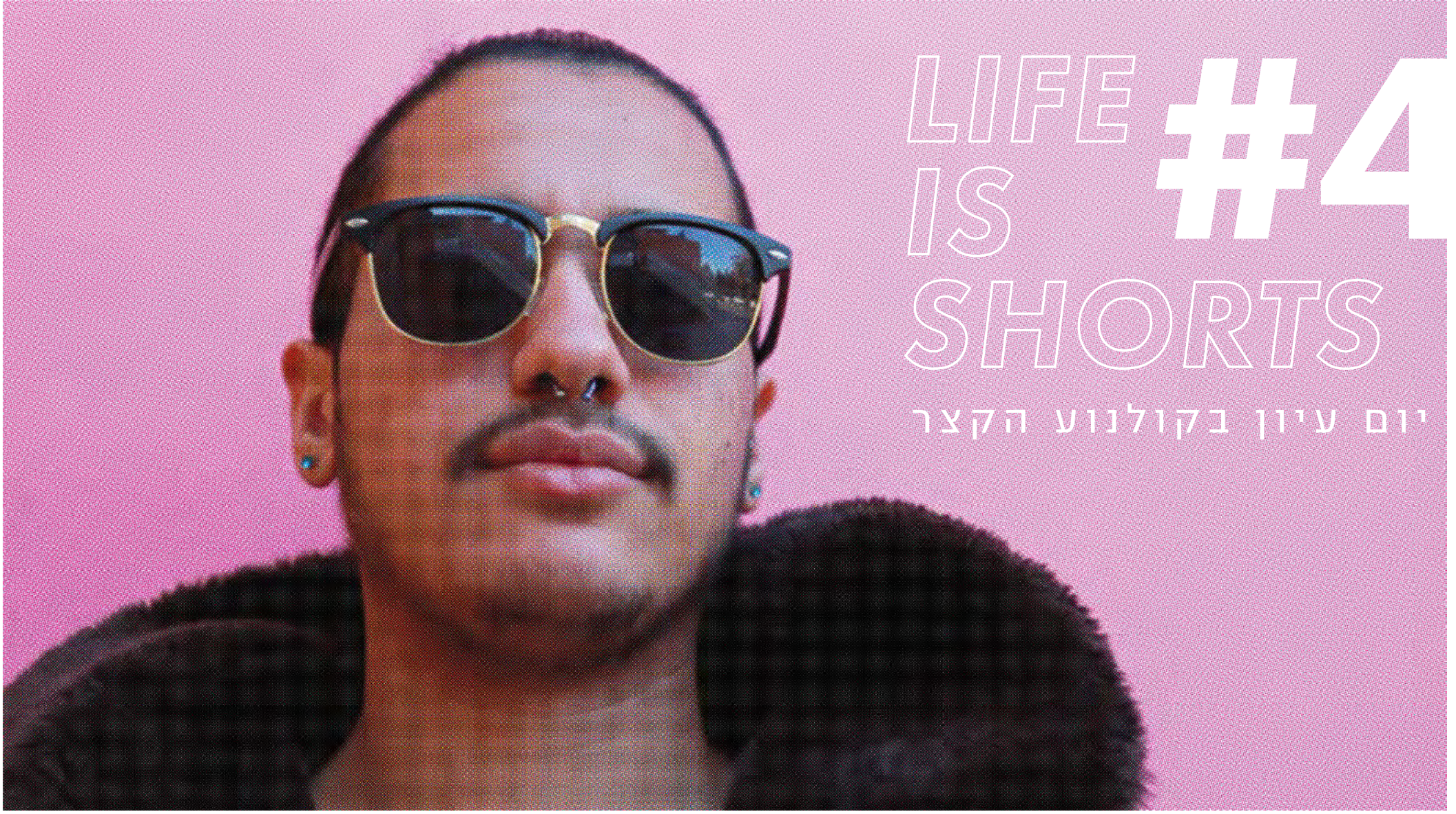
מתוך הסדרה - על הרצף