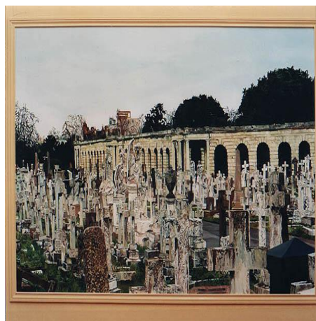
בית קברות 2