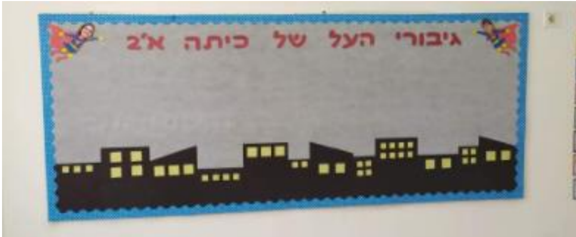
الأبطال الصّفوة لصفّ الأوّل 2