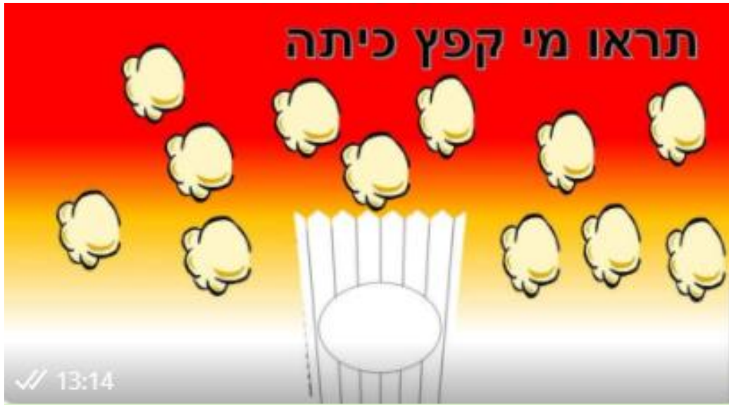
انظروا مَن قفزَ